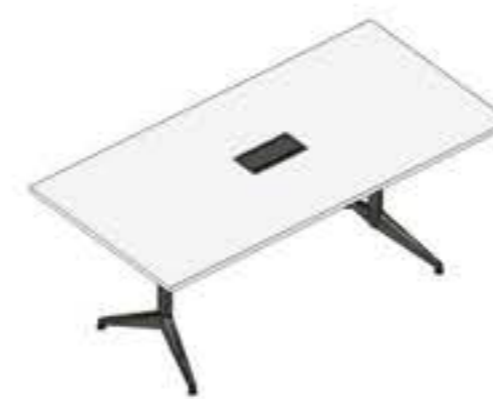
MESA PARA REUNIÃO