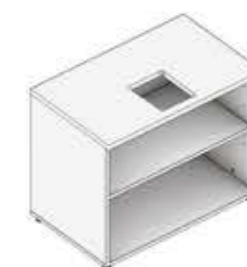
ARMÁRIO ABERTO COM RASGO PARA ELETRIFICAÇÃO