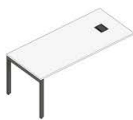
MESA EM BALANÇO