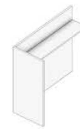
PAINEL DE FECHAMENTO