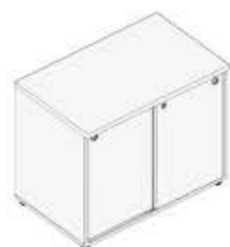
ARMÁRIO COM PORTA DE CORRER