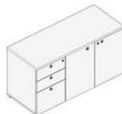
ARMÁRIO COM PORTA DE ABRIR, 2 GAVETAS E UM GAVETÃO