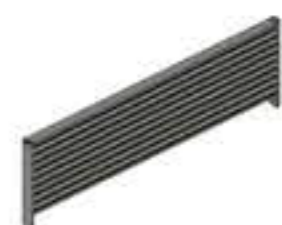
DIVISOR DE ALUMÍNIO