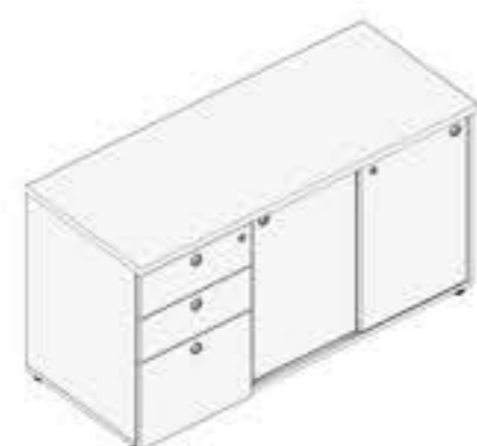
ARMÁRIO COM PORTA DE CORRER, 2 GAVETAS E UM GAVETÃO