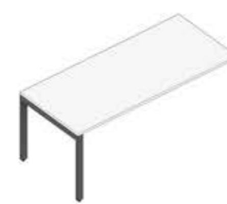
MESA EM BALANÇO SEM CAIXA ELÉTRICA