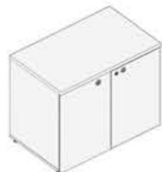
ARMÁRIO COM PORTA DE ABRIR