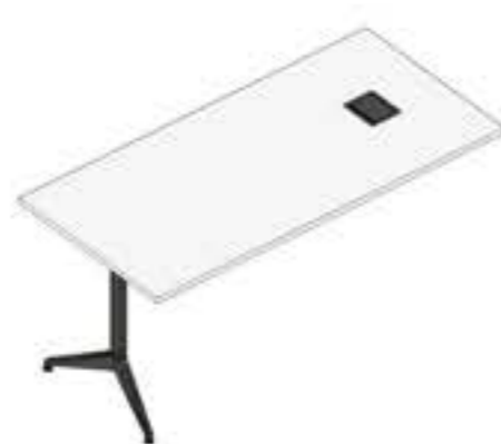
MESA EM BALANÇO