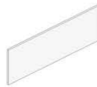
DIVISOR SCREEN FRONTAL