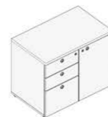
ARMÁRIO COM 1 PORTA, 2 GAVETAS E UM GAVETÃO